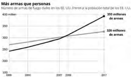
Gráfica #2. Número de armas de fuego civiles en EE.UU. Vs. población total.